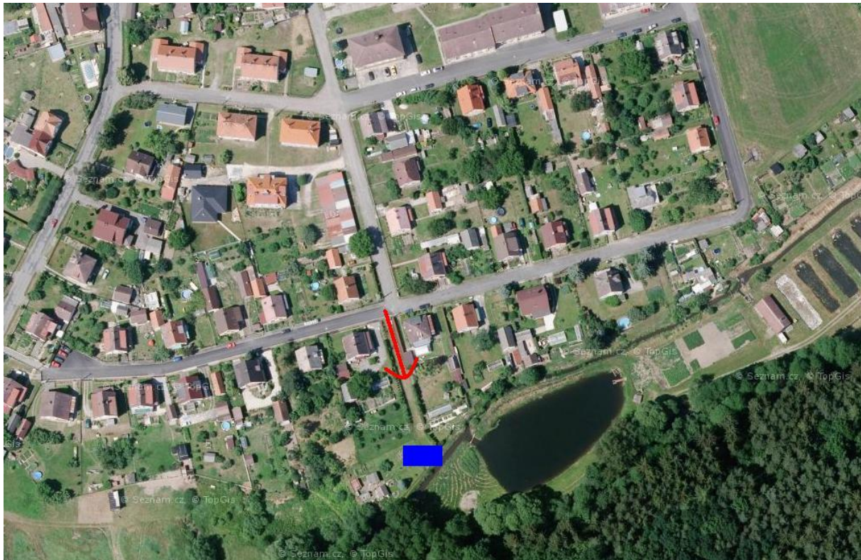
Mapa č. 3 umělé zdroje – modrými body jsou vyznačeny podzemní hydranty v obci